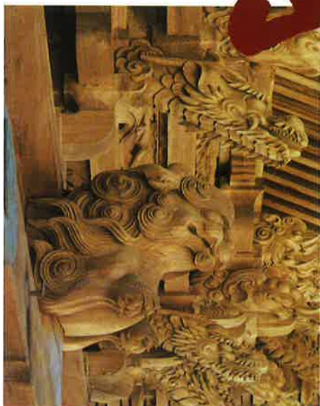
国指定重要文化財