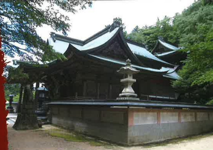
国指定文化財：箸蔵寺本殿