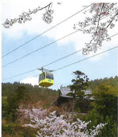
全長950m 所要時間／約4分 32人乗りゴンドラ