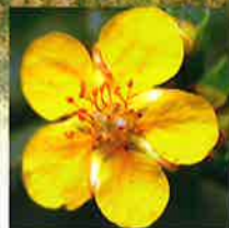
キンロバイ 開花6月～7月