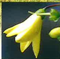
キレンゲショウマ 開花7月下旬～8月中旬