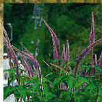
クガイソウ 開花6月下旬～7月