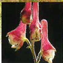
レイジンソウ 開花8月下旬～9月