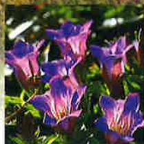
リンドウ 開花8月下旬～9月

四国の屋根と呼ばれる剣山山系主峰「剣山」は、標高1955mで西日本第2の高さを誇ります。