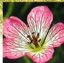
シコクフウ 開花7月～8月