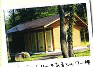
コインランドリーもあるシャワー棟

受付カウンター、レンタル用品の貸出ができる、セントラルロッジ。ゲームやバドミントンで遊べる多目的ホール(50人~150人収容)もあります。