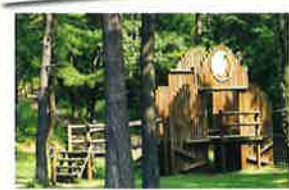
森のアスレチックもあるよ!