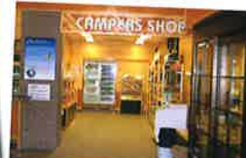
ロッジの中の売店