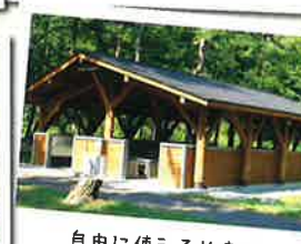
自由に使える炊事棟