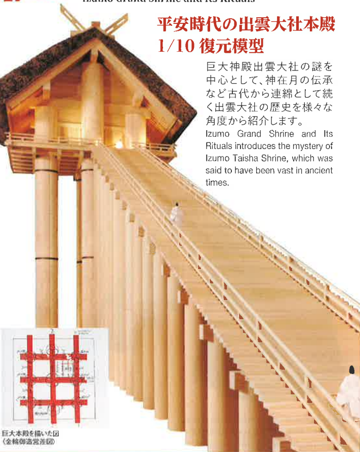
巨大本殿を描いた図 (金輪御造営遺団)

巨大神殿出雲大社の謎を中心として、神在月の伝承など古代から連綿として続く出雲大社の歴史を様々な角度から紹介します。Izumo Grand Shrine and Its Rituals introduces the mystery of Izumo Taisha Shrine, which was said to have been vast in ancient times.