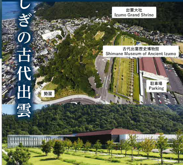
出雲大社 Izumo Grand Shrine

Izumo, located in northwest Japan, is said to be the land of the gods and is an important area for knowing the origins of Japan. Experience the magnificent myths and many cultural heritages that have been designated as Japanese national treasures.