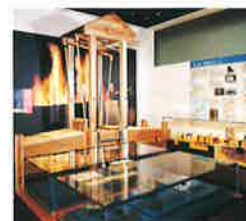
たたら製鉄「天秤ふいご体験模型」

The general exhibitions introduce valuable cultural properties related to Shimane, such as Iwami Ginzan, the famous silver mine, which is registered as a World Heritage Site.