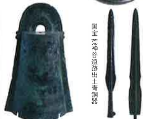
重文 三角縁神獸鏡 (神原神社古墳出土)

見る者を圧倒する国宝の青銅器群や卑弥呼の鏡とも言われる三角縁神獸鏡、そして古墳時代の豪華な装飾大刀。これら歴史的な発見の数々を通して、いにしへの島根の謎と実像に迫ります。The 419 bronze swords and bells exhibited, thought to be from 2000 years ago, are all national treasures. It is easy to see the prosperity of ancient Izumo today.