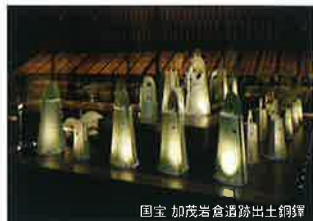
国宝 加茂岩倉遺跡出土銅鐸