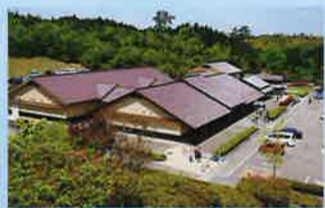
石見銀山世界遺産センター TEL 0854-89-0183