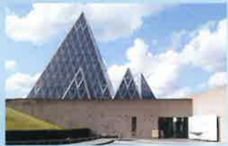
仁摩サンドミュージアム TEL 0854-88-3776