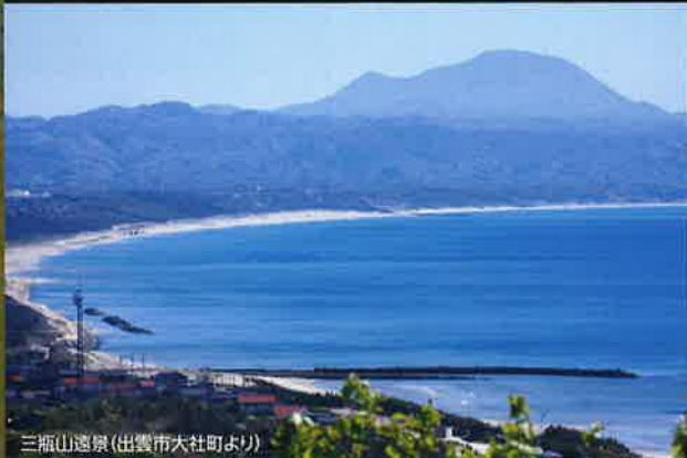
三瓶山遠景(出雲市大社町より)

約四千年前、その火山灰は山麓の森を埋めました。 神話の山が太古の森を残してくれたのです。