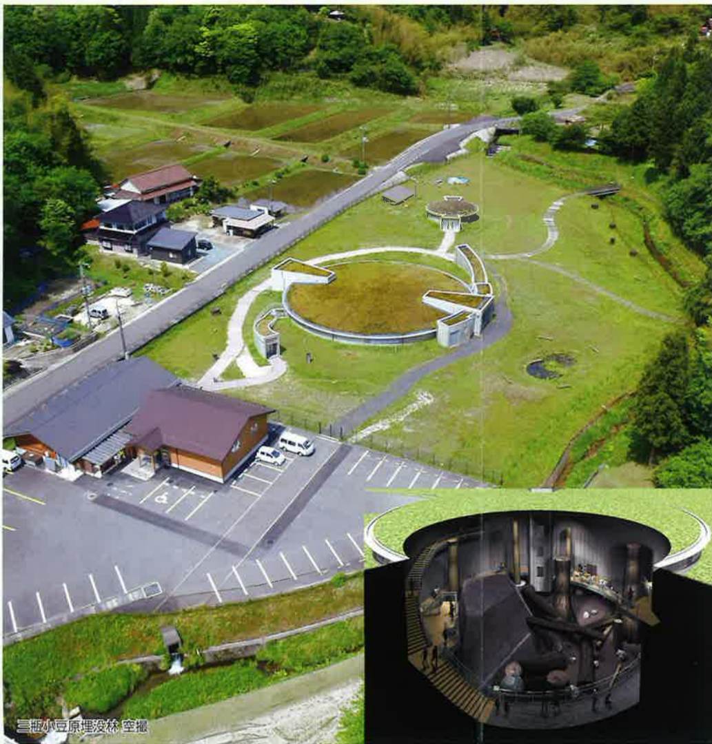
三瓶小豆原埋没林 空撮

1998年に島根県が発掘調査を実施し、立木群が埋もれていることを確認しました。 写真中央の立木は掘り出されて三瓶自然館に展示されています。