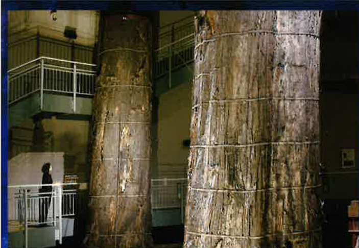
《縄文の森発掘保存展示棟》 深さ13mの地下展示室で縄文時代の森を現地展示しています。