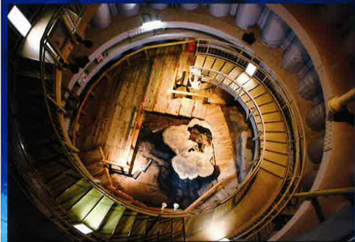
《根株展示棟》 森の世代交代を物語る奇妙な形状をした根株を展示しています。