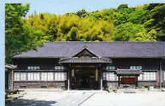
石見銀山資料館 (大森代官所跡) TEL 0854-89-0846