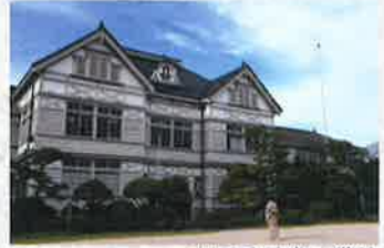
旧遷喬尋常小学校