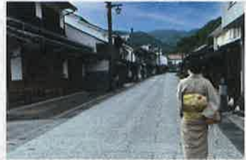
勝山町並み保存地区