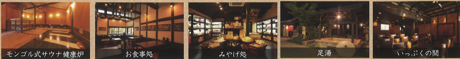
モンゴル式サウナ健康炉 長時間くつろげる「滞在型」遠赤外線サウナです。館内着のまま男女で楽しめます。 お食事処 四季を満喫する地元の新鮮な山の幸や清流の幸をご堪能ください。丼ぶり・そば・うどん・一品などもございます。 みやげ処 紀州の名物や特産品を取り揃えました。八風ノ湯オリジナル商品もございます。 足湯 ゆったりのんびり、足湯でぐら〜り。気軽に楽しみたい。 いっぶくの間 テレビ付リクライナーやまんが処でゆっくりお過ごしください。

宴会処 バリエーション豊富なコース料理をご用意。ご予算や人数に合わせたオリジナルプランのご相談もお気軽にどうぞ。 韓国式あかすり & エステ 本場韓国のスタッフによる、美肌から疲労回復まで効果のある本格的なあかすりです。 リラクゼーション 温まった後のカラダをケアし、ココロもスッキリ。全身リフレッシュ!!