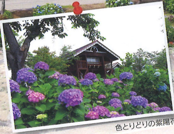
色とりどりの紫陽花