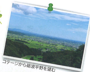
コテージから砺波平野を望む