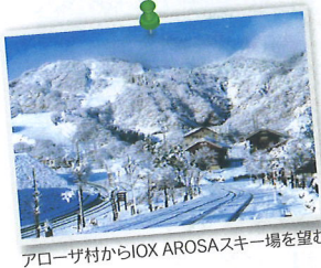
アローザ村からIOX AROSAスキー場を望む

IOXの語源は、医王山の「いおう」と未来を現す「X」から発しているものであり、金沢市と南砺市との間にある「医王山」(標高939.16m)が未来に向かってますます発展し、身近なものとなることを願って付けられた名前でもあります。