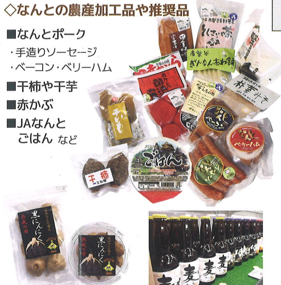
◇なんと育ち「熟成黒にんにく」