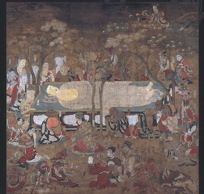
IV期展示 国宝 仏涅槃図 金剛峯寺