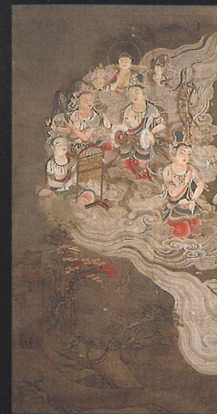
I期展示 国宝 阿弥陀聖衆来迎図 有志八幡講