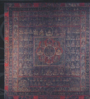
III期展示 重要文化財 両界曼荼羅図(血曼荼羅) 金剛峯寺