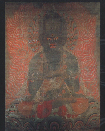
II期展示 国宝 五大力菩薩像 金剛吼 有志八幡講