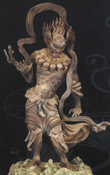
通期展示 重要文化財 執金剛神立像・深沙大将立像 快慶作 金剛峯寺