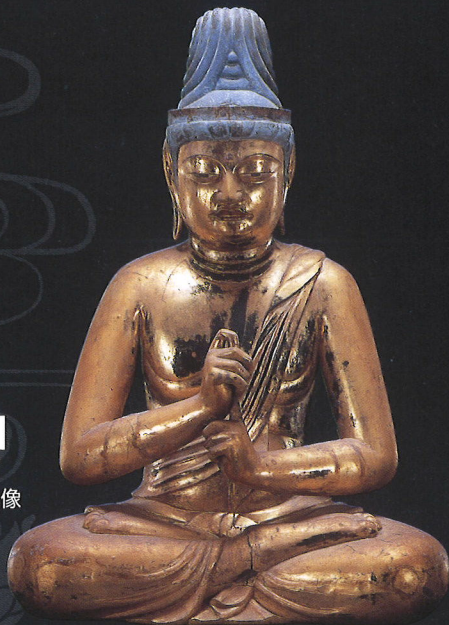
通期展示 重要文化財 大日如来坐像 金剛峯寺

これを記念して、高野山霊宝館開館100周年記念大宝蔵展「高野山の名宝」を開催し、収蔵する国宝、重要文化財の中から選りすぐりの文化財を出陳いたします。出陳品には、弘法大師空海ゆかりの三大秘宝「国宝 誓誓指帰」、「国宝 諸尊仏龕」、「重要文化財 飛行三鈷杵」を始め、鎌倉時代の運慶作「国宝 八大童子立像」、快慶作「重要文化財 孔雀明王像」など、普段は目にする事の出来ない文化財を一挙公開いたします。是非ともこの機会にご来館いただき、高野山の名宝をご覧ください。