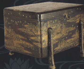
I期展示 国宝 澤千鳥螺鈿時絵小唐櫃 金剛峯寺