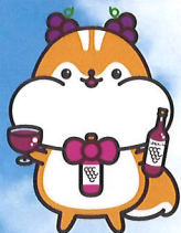
島根ワイナリーキャラクター しまりん