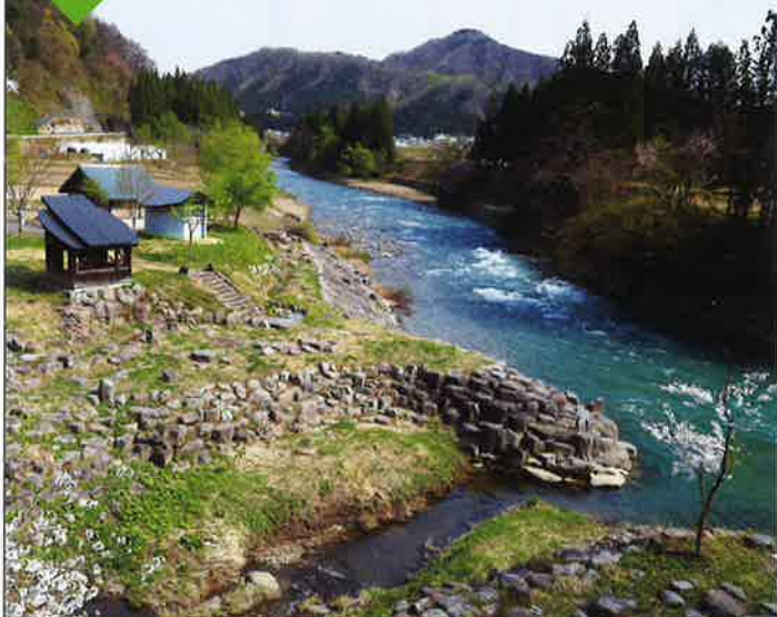
ほたるの里公園 栗駒に源を発する清流・成瀬川。村内には川が目前で大きくうねる迫力ある景観など川景色の見所が随所にあります。その一つ「ほたるの里公園」は、散策コースとしておすすめです。mapA-1