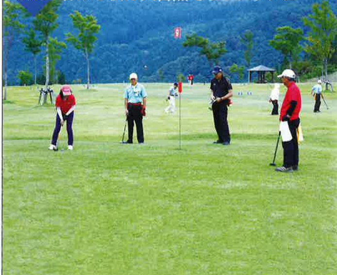
ジュネス栗駒パークゴルフ場 日本パークゴルフ協会認定の36ホール・4コースのゴルフ場。ちびっ子からお年寄まで楽しめます。間近に「やまゆり温泉」があり森林浴と温泉浴をお楽しみいただけます。mapB-3