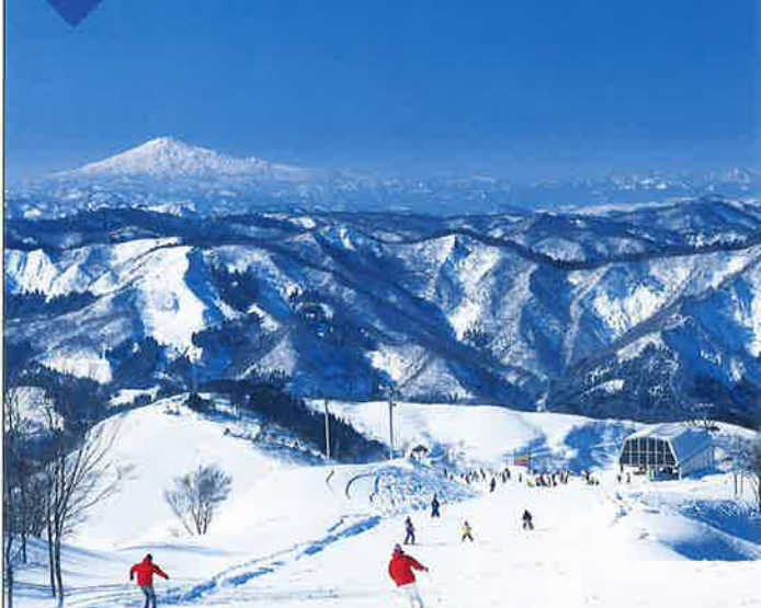
ジュネス栗駒スキー場 多彩なコースとゲレンデに直結する温泉ホテルや各種レストランなど、施設も充実した大人気のスキー場。ゲレンデからは出羽富士・鳥海山を望むことができます。mapB-3