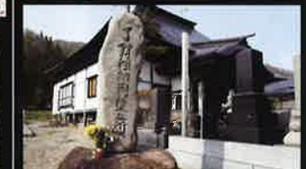
了翁禪師・剃髪石の石碑