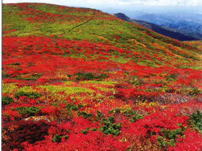
栗駒国定公園・焼石岳／栗駒山 mapB-4 / E-3 焼石連峰の主峰・焼石岳は花の名山。健脚者向けの縦走登山路です。栗駒火山群の主峰・栗駒山は温泉や火山地獄など多彩な景観。登山口の温泉や山裾のドライブも楽しめます。