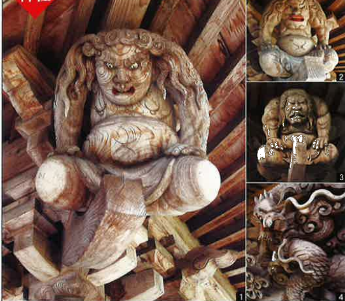
必見!! 見事な神社彫刻 屋根の四隅を支える力士像や龍神など各神社の彫刻は見応えある芸術品です。