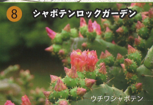
ウチワシャボテン