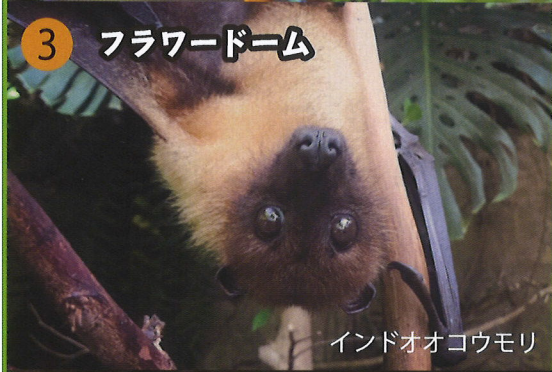
インドオオコウモリ