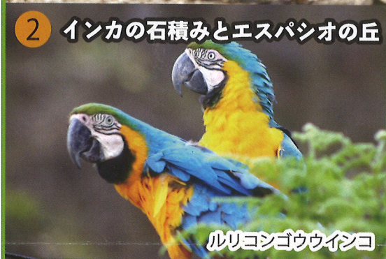
ルリコンゴウインコ