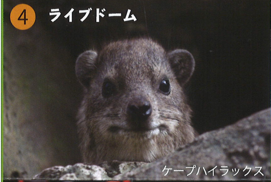
ケープハイラックス