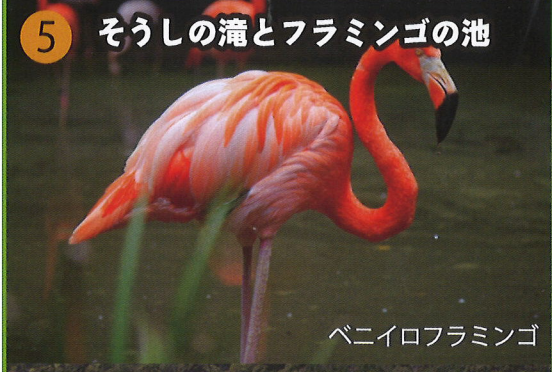
ベニイロフラミンゴ