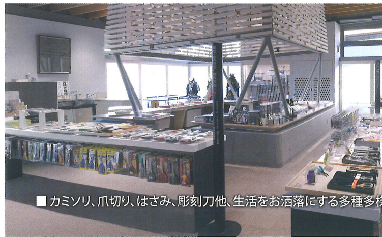
■カミソリ、爪切り、はさみ、彫刻刀他、生活をお洒落にする多種多様のツールエリア