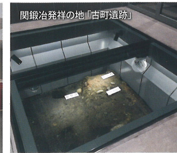
■古町遺跡は室町時代後期の鍛冶作業を行った遺跡です。館内エントランスで見られます。