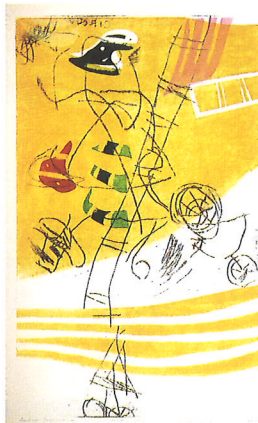
萩原英雄「サーカスNo.1」