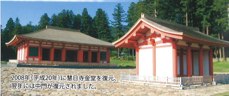
2008年(平成20年)に慧日寺金堂を復元、翌年には中門が復元されました。