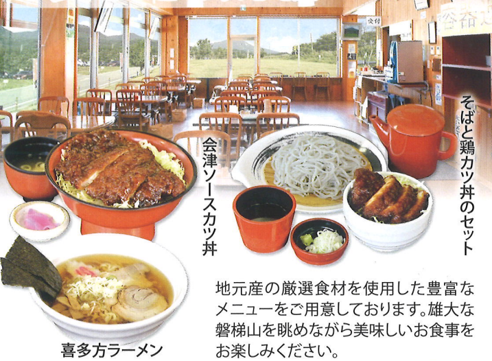
会津ソーラスカツ丼