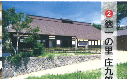
古民家を活用した観光案内所とカフェです。お気軽に憩いの時間をお過ごしください。