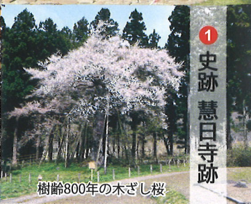
平安初期、高僧徳一によって開かれた寺院。東北地方では開基の明らかな寺院としては最古のものとして知られています。2000年(平成12年)には皇太子御夫妻*もお立ち寄りになりました。 ※令和の天皇陛下(徳仁さま)と雅子皇后さま