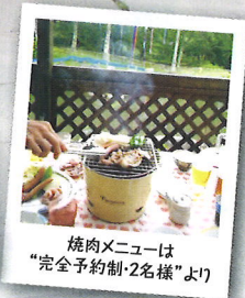
焼肉メニューは "完全予約制・2名様より"

団体様・会社様・サークルなどの親睦会やレクリエーションのご相談(20名様まで)も承ります。 お気軽にお問い合わせください!