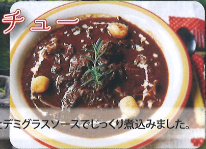
上質な鹿肉を、赤ワインとデミグラスソースでじっくり煮込みました。