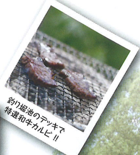
釣り堀池のデッキで 特選和牛カルビ!!