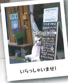
いらっしゃいませ!