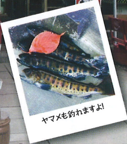
ヤマメも釣れますよ!