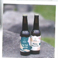
ハケ岳山麓のクラフトビール 8Peaks オススメです!