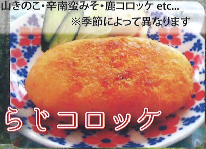
姫の木わらじコロッケ

季節の山菜や山きのこを使った手づくりコロッケです。 ふきみそ・野沢菜キムチ・山きのこ・辛南蛮みそ・鹿コロッケ etc... ※季節によって異なります