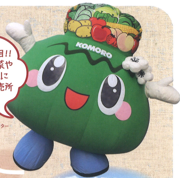
小諸市 地産地消推進キャラクター こもろん

小諸の「農」にも大注目!! 小諸の新鮮な高原野菜や 果物はみんなを元気に するよ!まずは市内直売所 に寄ってみてね!