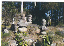
白雲山中世古墓群

登山道は三十三観音の参道となっており、やまと温泉を起点に約1時間で周回することができます。途中に設けられた休憩所からは、長良川と市街地を見渡せ、森にはヤマツツジを中心にサクラ、カエデ、ヤマボウシなどが点在し、四季おりの景色を彩ります。