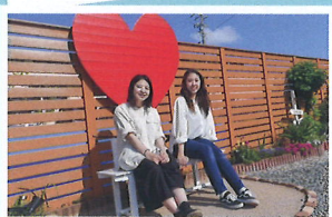
ハート写真スポット