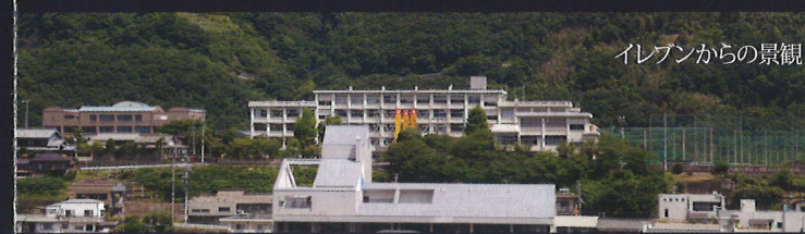
イレブンからの景観

会議・研修に最適なテーブル席を配置した洋室。こちらもパーティションにより分割が可能。ご宿泊の際には2階共同シャワールームをご使用頂けます。