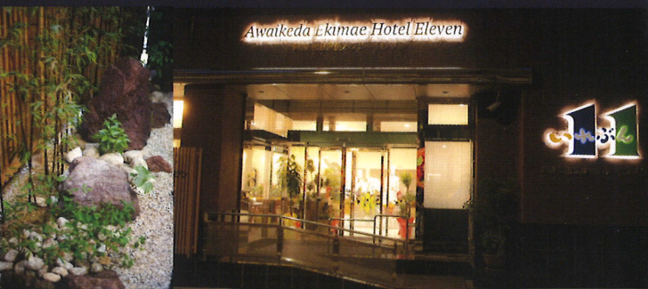
Awaikeda Ekimae Hotel Eleven

三好市の中心市街地に位置し、周囲に公共機関・コンビニ・ショッピングモール等が集約。観光・ビジネスの拠点として、快適なご滞在が可能です。