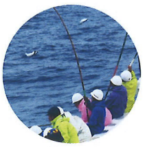
カツオの一本釣り漁が盛ん

個性豊かなガイドと行く！ プロ漁師の船に乗って！ 海のおさんぽ whale watching