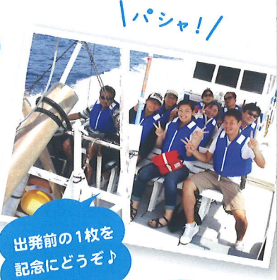
出発前の1枚を記念にどうぞ♪

空の色をうつす広い海は、まさに美術館のように美しい。輝く水面・潮の香り・吹き渡る風を感じ、地球の大きさを体感できる360度水平線の世界へ。案内人は、この海(クジラの個性も♡)を知り尽くしたプロ漁師！海とこの町が大好きなガイドと一緒に漁船に乗って、そこに暮らす仲間たちと同じ空間を過ごす非日常体験。悠々と気ままに出迎えてくれる彼らの姿は、私たちが素直で優しい気持ちにしてくれます(^^)