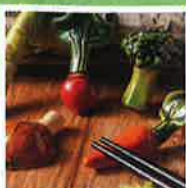
※賞品の写真はイメージです