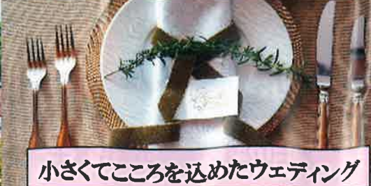
小さくてこころを込めたウェディング