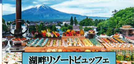
湖畔リゾートピュッフェ