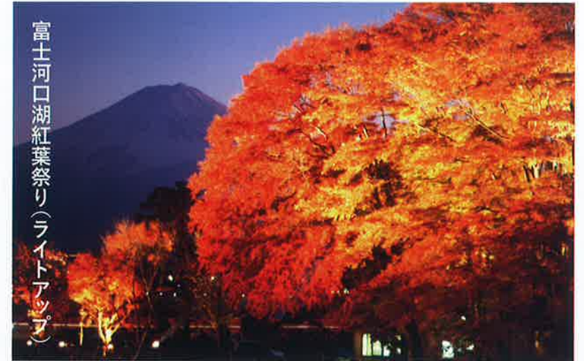
紅葉時期 10月29日～11月23日 Best season for autumn leaves October 30th to November 23th