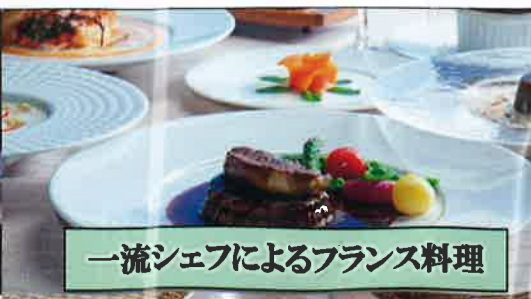
一流シェフによるフランス料理