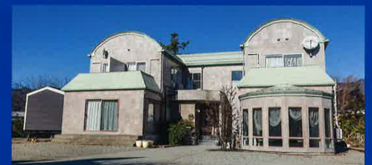
シャリアホテル 富士山

ホステルイン 富士山 TEL 0555-83-3205 シャリアホテル 富士山 TEL 0555-83-5588