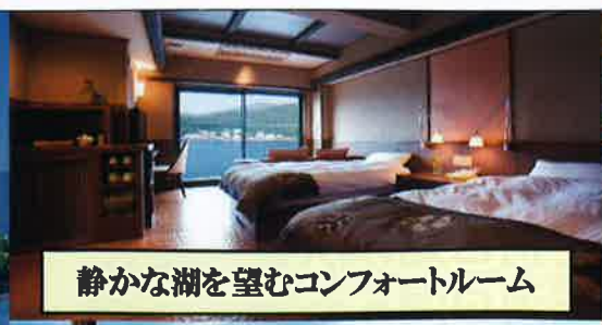
静かな湖を望むコンフォートルーム

富士レイクホテル 河口湖随一の本格派Resort 山梨県南都留郡富士河口湖町船津1番地 TEL: 0555-72-2209 FAX: 0555-73-2700 【予約受付時間 9:00～20:00】 https://www.fujilake.co.jp/