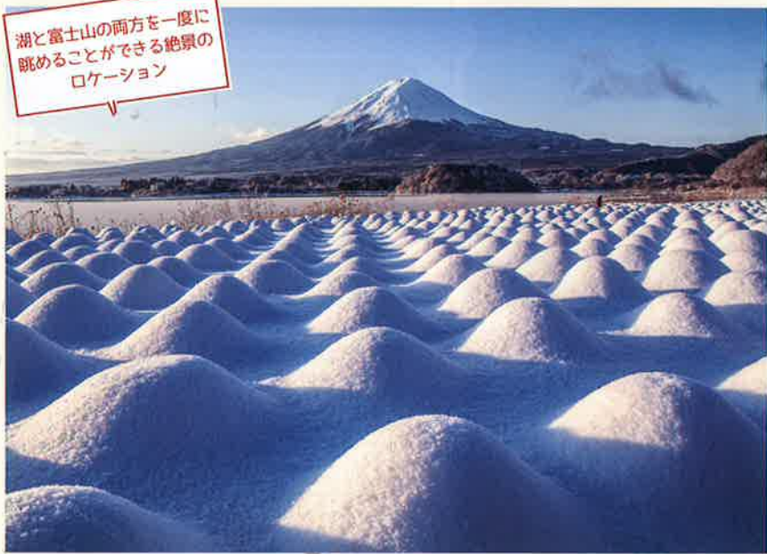
湖と富士山の両方を一度に眺めることができる絶景のロケーション