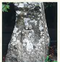
19 路傍の情熱(一) 下竹田中通り (年代不明)