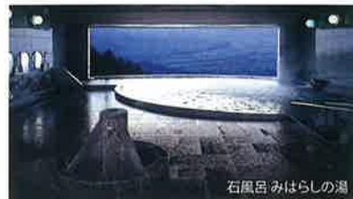
石風呂 みはらしの湯

お問い合わせ TEL.0263-98-2300 HP: http://www.sl-kiyomizu.jp/