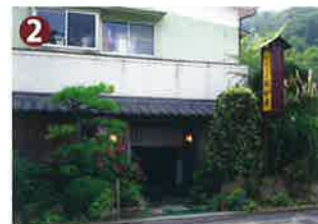
石碓き蕎麦 水舎 本店★ TEL.0263-98-3002

清水高原に向かう道の脇に、数軒のそば屋さんが点在しています。唐沢川の水で水車を回し、粉挽き仕事をしていた昔からの歴史ある地域で、当時から振舞われていたそばの素朴な味を今に伝えています。他にも村内で、おいしいそばを食べられるお店はたくさんあります。