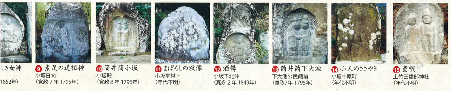
15 童唄 上竹田建部神社 (年代不明) 14 小人のささやき 小坂中原町 (年代不明) 13 筒井筒下大池 下大池公民館前 (寛政7年 1795年) 12 酒樽 小坂下北沖 (嘉永2年 1849年) 11 まぼろしの双像 小坂堂村上 (年代不明) 10 筒井筒小坂 小坂殿 (寛政8年 1796年) 9 素足の道祖神 小坂日向 (寛政7年 1795年) 8 しき女神 (1852年)