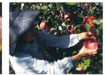
りんご 8月下旬~11月中旬 ご家族そろって楽しいりんご狩りが体験できます。また収穫体験だけでなく、りんごの木のオーナーになる制度もあります。