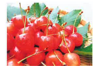
さくらんぼ 6月下旬~7月上旬 甘酸っぱくておいしい大人気のフルーツ狩り。食べ放題プランや量り売りプランなど農家さんごとに様々なプランがあります。

山形村は果物、野菜の種類が豊富。大自然の中、自分好みの収穫体験を楽しんだ後は、直売所で農家の皆さんが自信を持ってお届けする旬な農産物をお土産に買って帰るなんて、果物・野菜づくし一日の過ごし方もおすすめです。