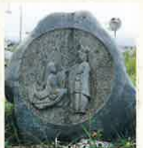
17 車屋美人 下竹田唐沢 (弘化2年 1845年)