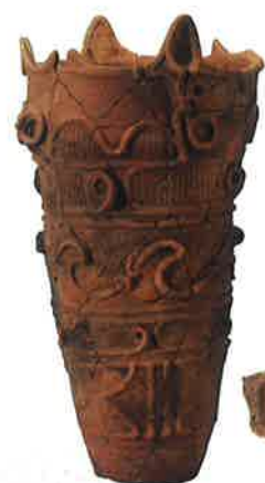
深鉢型土器 (殿村遺跡出土)