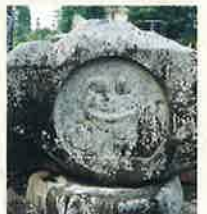
18 四良右門兼氏 下竹田北村 (嘉永3年 1850年)