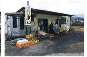
ふれあい農園「いもっこ」 TEL.0263-98-2401 生産農家が営む直売所(営業期間 7月~12月)