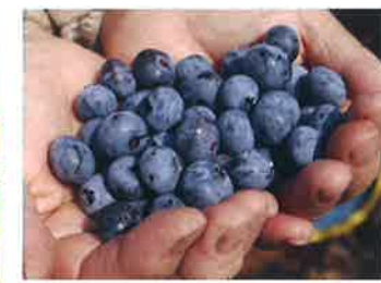
ブルーベリー 7月中旬~8月中旬 村内には摘み取り農園がたくさんあり、夏場は大勢のお客さんで賑わいます。時間を忘れてついたくさん採ってしまいますよ。