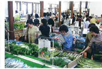
ファーマーズガーデンやまがた TEL.0263-98-5231 野菜、果物、花など品揃え豊富。