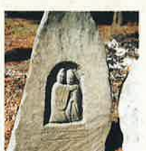
16 路傍の情熱(二) 上竹田建部神社 (年代不明)