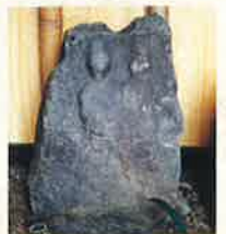
20 復活 ふるさと伝承館内 (年代不明)