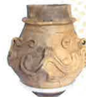
有孔罎付土器 (下原遺跡出土)