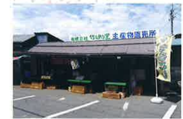
地場産品直売所「竹田の里」 TEL.0263-98-3877 そば粉や凍りもちなど、郷土の食材も人気です。

特産の長いもをはじめ、スイカ、白ネギ、アスパラガスなど村内で収穫された旬な食材がお手軽にお求めいただけます。