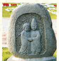
21 水色山路 ミラ・フード館前 (平成2年)