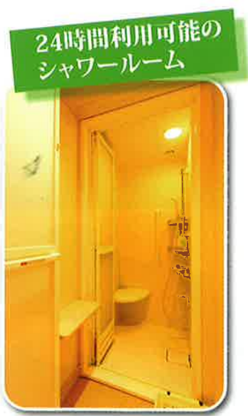
24時間利用可能の シャワールーム