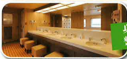
身だしなみを 整えられるスペースも