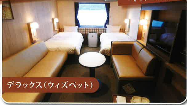
デラックス(ウィズペット)