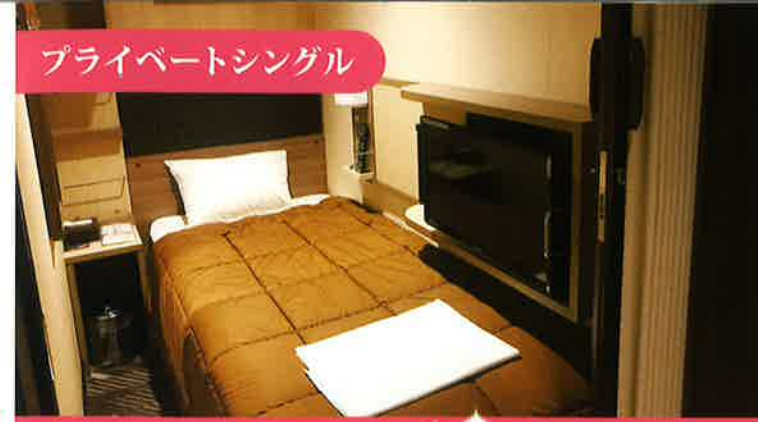
プライベートシングル

デラックス(ウィズペット)…2~4名様定員(17.10㎡)×10室 シャワー・トイレ・洗面台を設置。 設備…テレビ・冷蔵庫・電気ケトル・空気清浄機