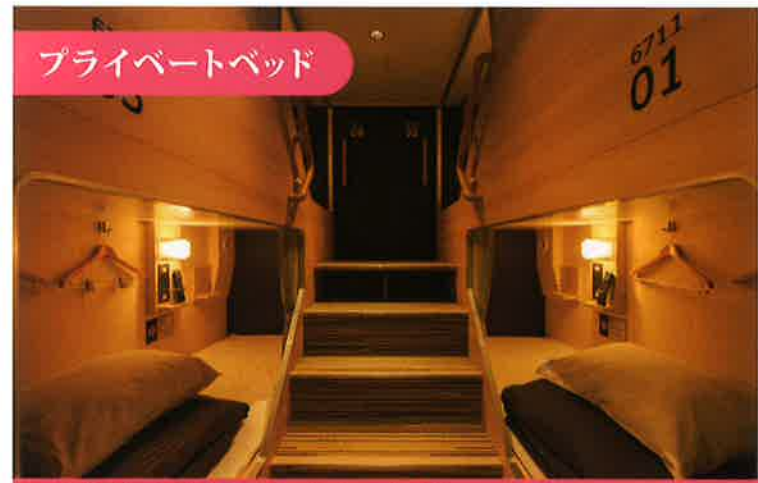
プライベートベッド

・相部屋タイプながら、プライバシーを重視。 ・階段式のアプローチで、安全面にも配慮。・各ベッドにテレビを設置。