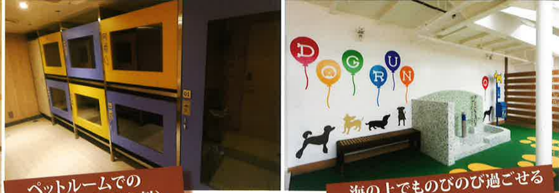
海の上でものびのび過ごせる 「ドッグラン」も併設。