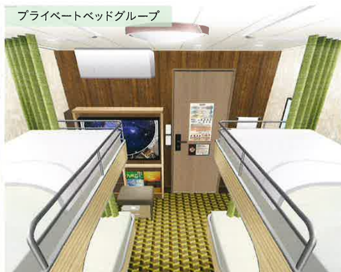
プライベートベッドグループ