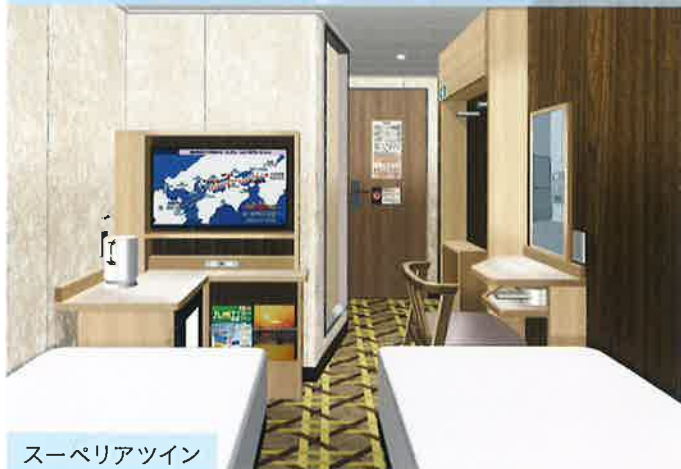
スーパーリアツイン