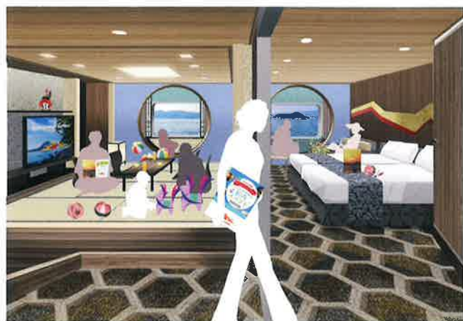
セミデラックス和室コネクト(左) デラックスコネクト(右) ↔つなげると『コネクティング_デラックス』