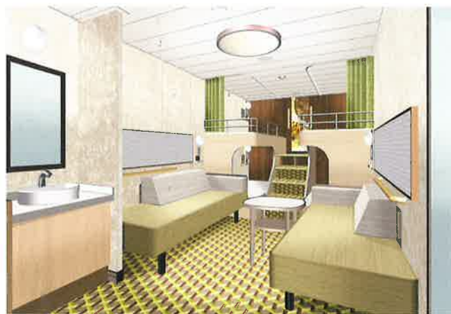
プライベートベッドグループ(写真は6名定員)