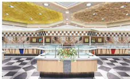
レストランの席数は現行船の1.5倍に