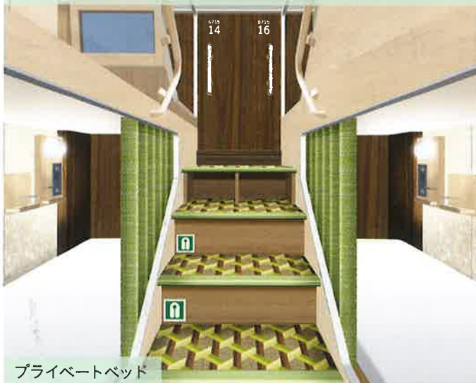
プライベートベッド