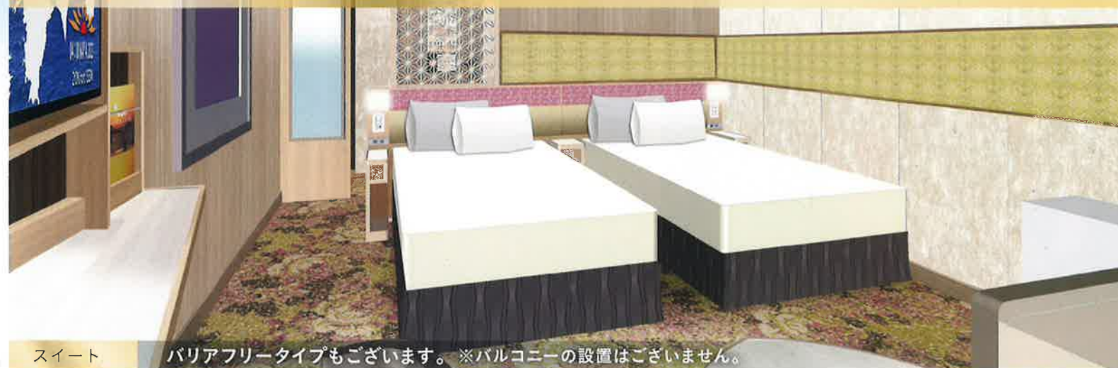
スイート バリアフリータイプもございます。※バルコニーの設置はございません。

宿泊者専用バルコニーを構えたプライベート空間で、 最上級の快適な船旅をお約束いたします。