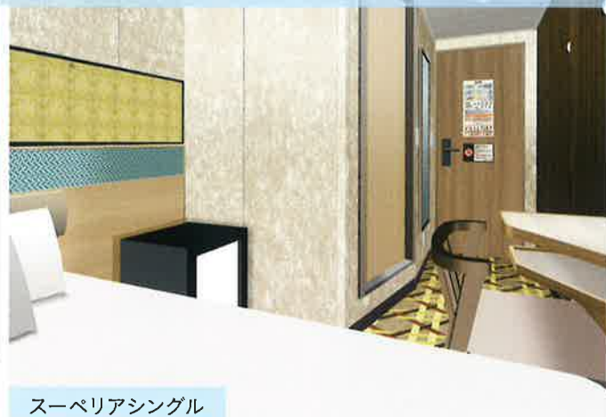
スーパーリアシングル