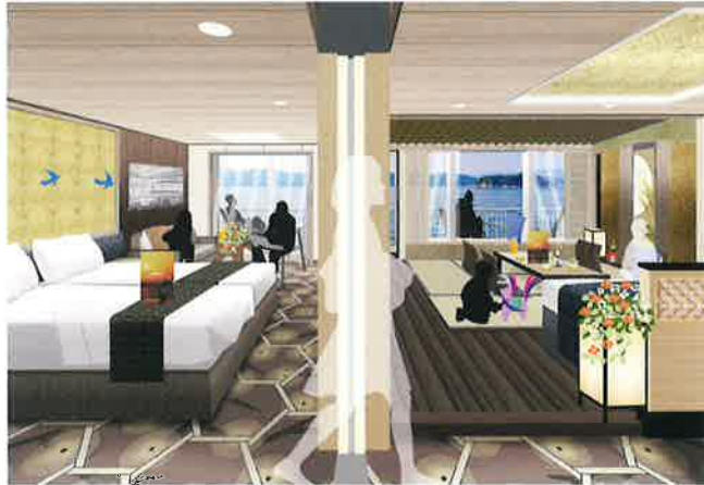
セミスイートコネクト(左) スイートと洋室コネクト(右) ↳つなげると『コネクティング_スイート』

2部屋が内扉でつながる「コネクティングルーム」をご用意。和室と洋室をコネクต์することで、 3世代でご乗船のお客様に大変便利にご利用いただけます。