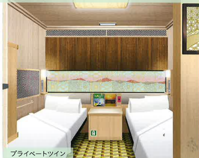
プライベートツイン