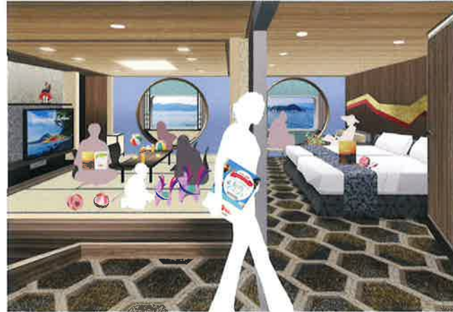
セミデラックス和室コネクト(左) デラックスコネクト(右) ↳つなげると『コネクティング_デラックス』