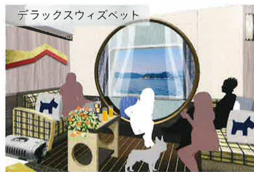
デラックススイズベット