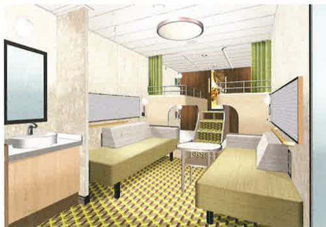
プライベートベッドグループ(写真は6名定員)