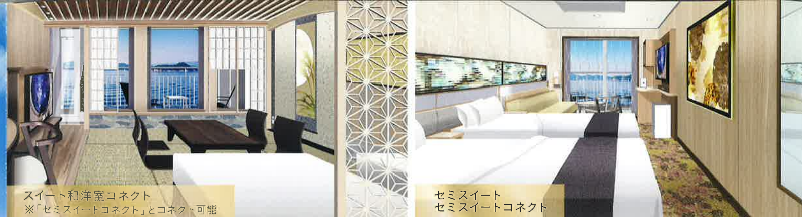
スイート和洋室コネクト ※「セミスイートコネクト」とコネクト可能