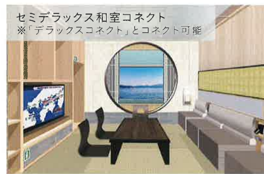
セミデラックス和室コネクト ※「デラックスコネクト」とコネクト可能