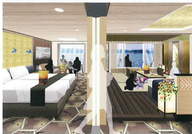
セミスイートコネクト(左) スイート和洋室コネクト(右) ↔つなげると『コネクティング_スイート』

2部屋が内扉でつながる「コネクティングルーム」をご用意。和室と洋室をコネクトすることで、 3世代でご乗船のお客様に大変便利にご利用いただけます。