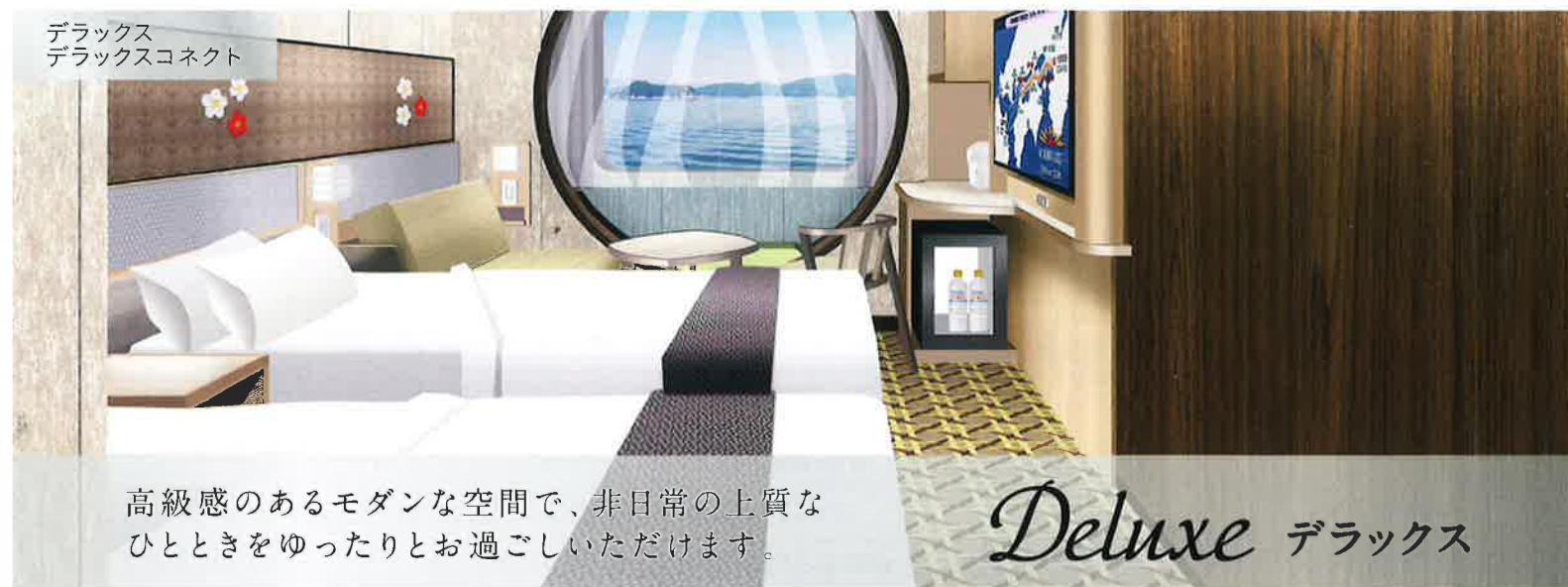
デラックス デラックスコネクト

高級感のあるモダンな空間で、非日常の上質な ひとときをゆったりとお過ごしいただけます。