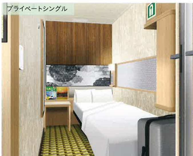
プライベートシングル