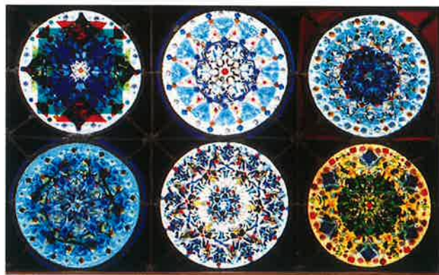
直径28cm日本最大のカレイドグラス 野市店内西壁に14個