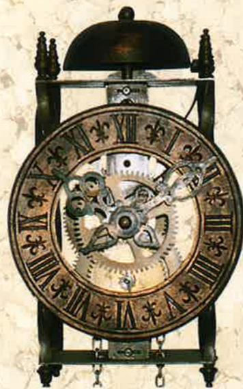
簡単な時打機構を備えた重力駆動の時計 イギリス製(年代不明)