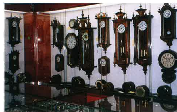
展示場の内部写真