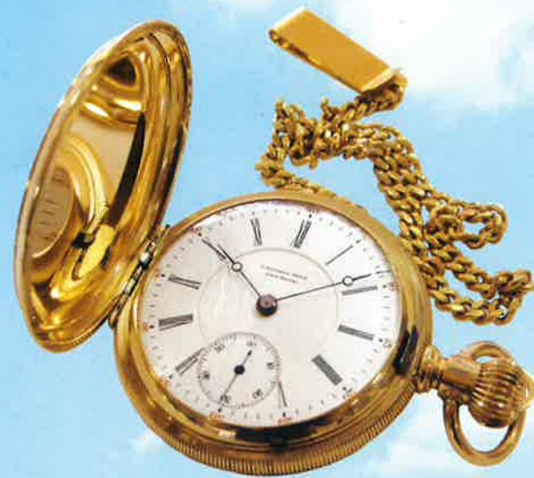
ランバートブロス アメリカ製

すぎし日の思い出が よみがえる古時計の世界 なつかしいゼンマイ時計の 刻音が あなたに ひとときのやすらぎを与えます