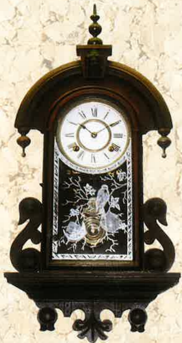
涙の雫 アンソニア社アメリカ製