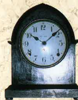
セストーマスの置時計 アメリカ製(1910年頃)

展示してある時計は全てCMW(公認高級時計師)と国家検定一級技能士によって整備・調整されています。