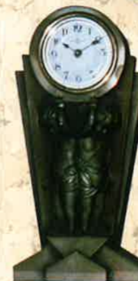
銅製の置時計精工舎製(1921年頃)