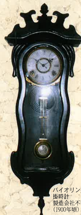
バイオリン型掛時計製造会社不明(1900年頃)