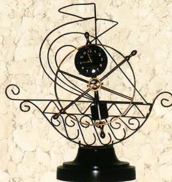
帆船の時計日本製(1918年)