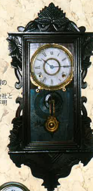
日本製の掛時計製造会社と年代不明