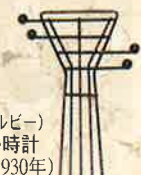
Welby(ウェルビー)の楽器型掛時計ドイツ製(1930年)