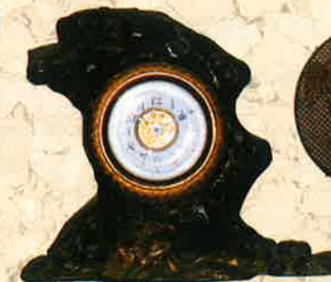
銅製の置時計精工舎製(1920年)