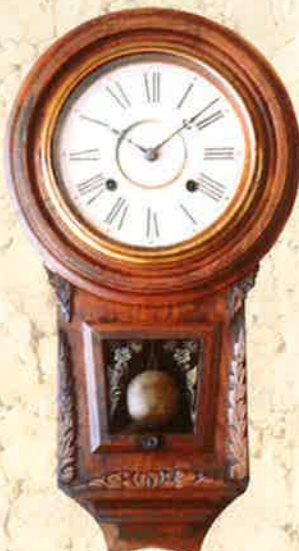
製造会社不明 日本製