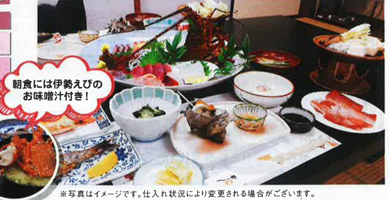
※写真はイメージです。仕入れ状況により変更される場合がございます。

客室 和室(2~3名)2室・シングル1室・ツイン2室・和洋室(2~5名)2室 食事条件 1泊2食付