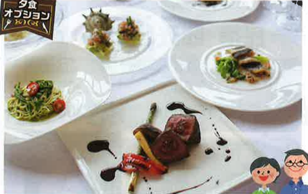
フレンチコース 大人7,800円~

※天候や水揚げ状況により料理食材・量が変更となる場合があります。又、2名様1室でご利用の場合個人盛りとなる場合があります。※料理の盛り付け・器・装などは入室人数により掲載の料理写真と異なる場合があります。あらかじめご了承ください。