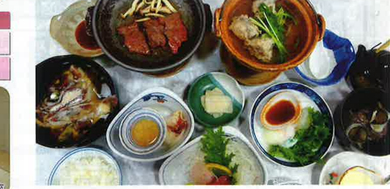
※写真はイメージです。仕入れ状況により変更される場合がございます。

アクセス 奈良尾港より車で15分 (南松浦郡新上五島町若松郷167) ☎0959-46-2020