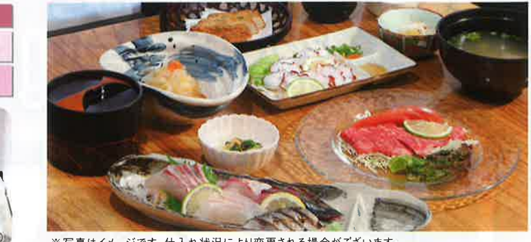
※写真はイメージです。仕入れ状況により変更される場合がございます。

客室 本館:和室(2~3名)3室・ツイン8室・新館:和洋室(3~4名)2室・洋室(2~3名)4室 食事条件 1泊2食付