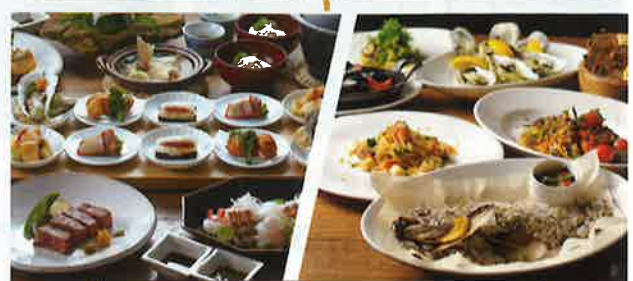
高ごはん 夕食は和食(高ごはん)かイタリアンのどちらかを選べます!! イタリアン