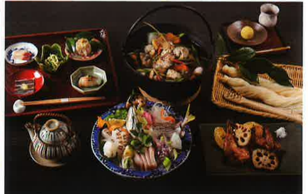
※写真はイメージです。仕入れ状況により変更される場合がございます。