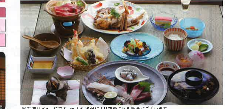
※写真はイメージです。仕入れ状況により変更される場合がございます。

アクセス 有川港から徒歩3分 (南松浦郡新上五島町有川郷574) ☎0959-42-0003